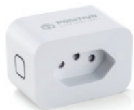
Smart Plug Wi-Fi (PPW1000-FFS)